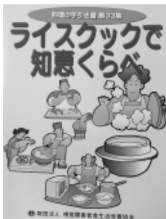
■「ライスクックで知恵くらべ」 定価：3,000円

さらに、本書は読みやすい 字(大活字)を採用しており、 目の不自由な人にも配慮して 点字、音声でも利用できる形 となっている。