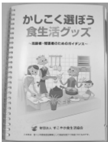
■「かしくく選ぼう 食生活グッズ」 定価：3,000円